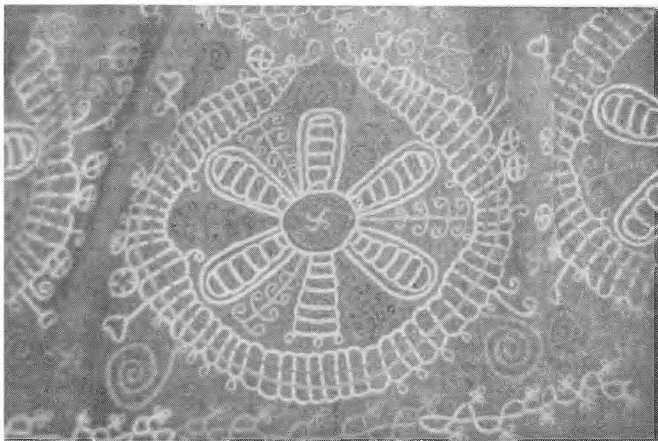
Рис. 2. «Круг» — «месяц». Фрагмент передника. Каргопольский краеведческий музей