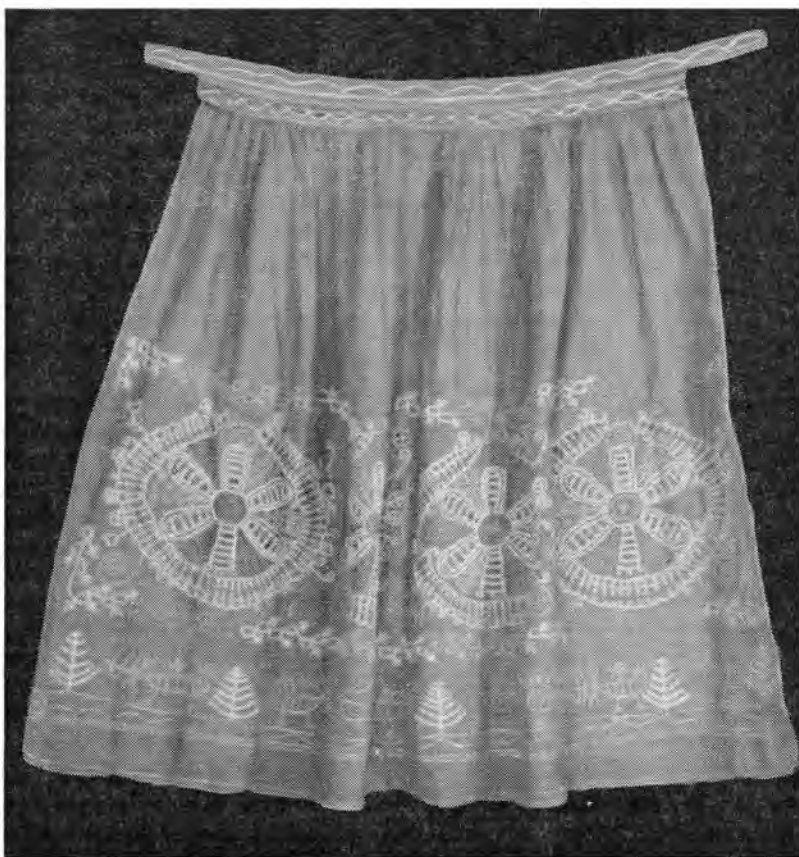
Рис. 1. Передник. Каргопольский краеведческий музей