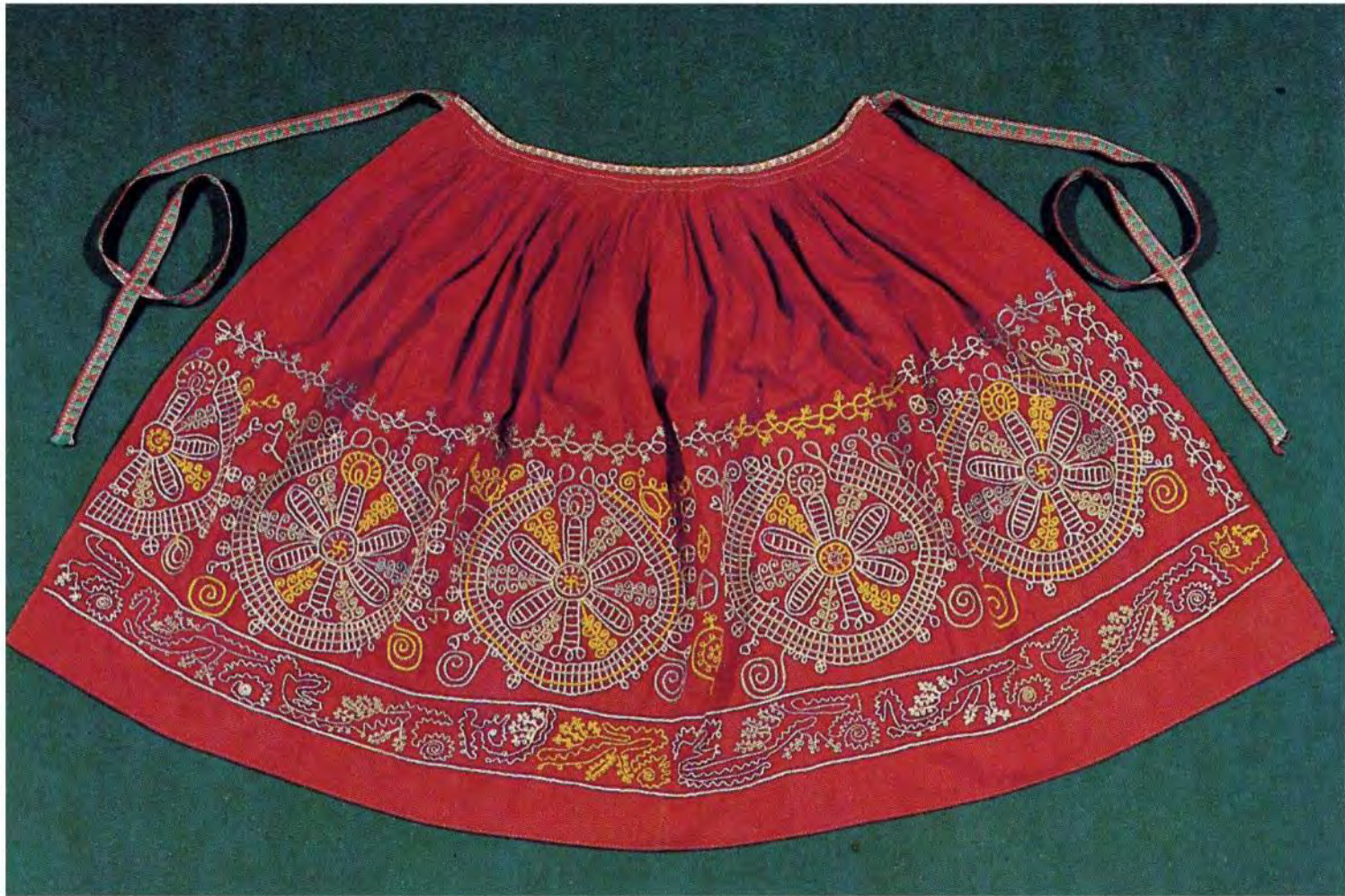
Каргопольский сельскохозяйственный месяцеслов вышитый на женском переднике. Конец XIX в. (Каргопольская глиняная игрушка, Г.П. Дурасов, Ленинград, «Художник РСФСР, 1986г.)