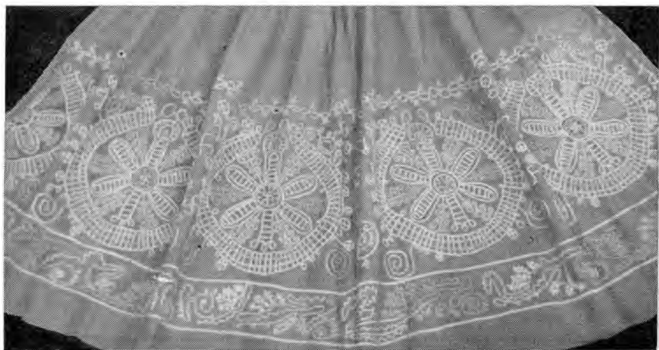
Рис. 4. Нижняя часть передника. Музей Московского текстильного ин-та, № 6853