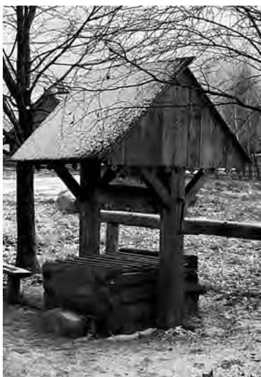
Крыты агульнавыкарыстаны колодца (музей народнай архітэктуры і быта в Озерках)