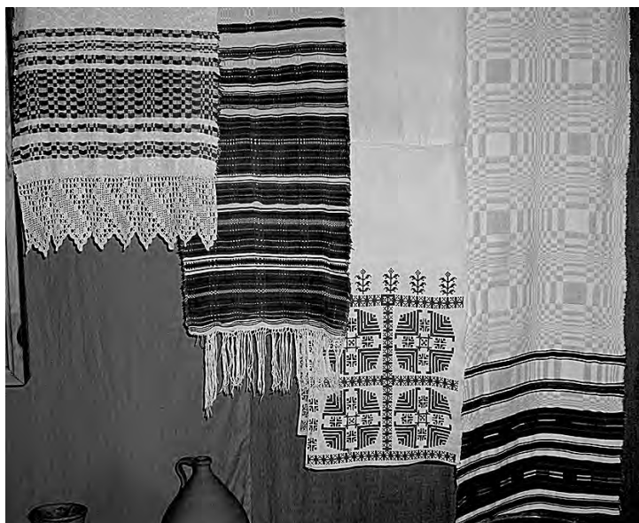
Домотканые занавески и рушники с традиционными обережными орнаментами центральной Беларуси (музей народной архитектуры и быта в Озерках)