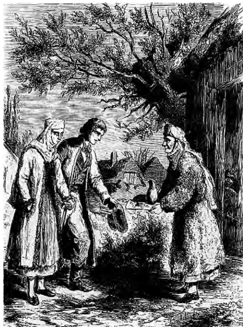
Встреча молодых (старинная гравюра)