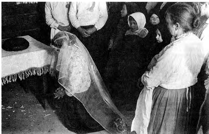
Прощание невесты с родительским домом (фото XIX века)