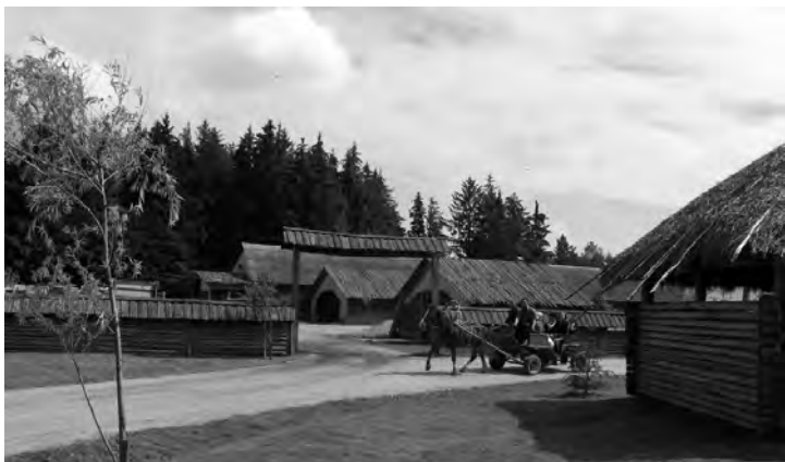
Усадыба зажиточнага беларускага крэсьцянина (музей в Дудутках)