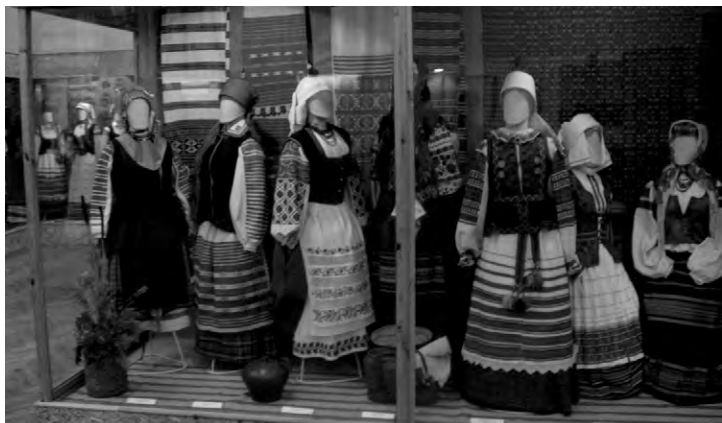
Национальные костюмы и ткани в экспозиции музея древнебелорусской культуры АН Республики Беларусь)