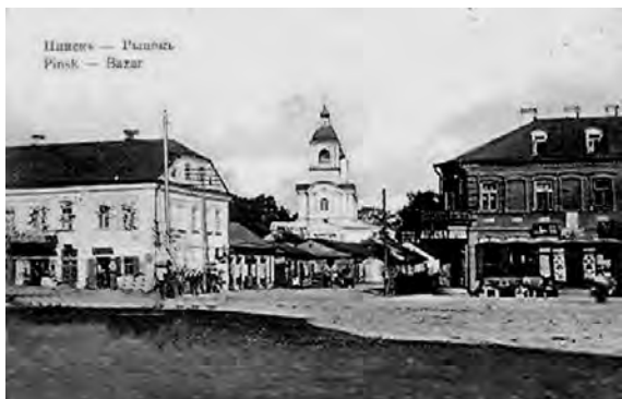
В и д г о р о д с к о г о р ы н к а в П и н с к е (с т а р и н н а я о т к р ы т к а)