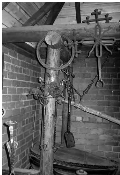
Кузница – место, с языческих времен также наделяемое славянами особым статусом (музей в Дудутках)