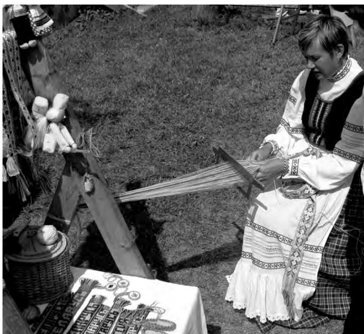
Искусство белорусских мастеров прошлого живо и сегодня