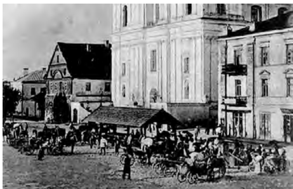
В и д ц е н т р а л ь н о й п л о щ а д и в Г р о д н о в к о н ц е X I X в е к а (с т а р и н н а я о т к р ы т к а)