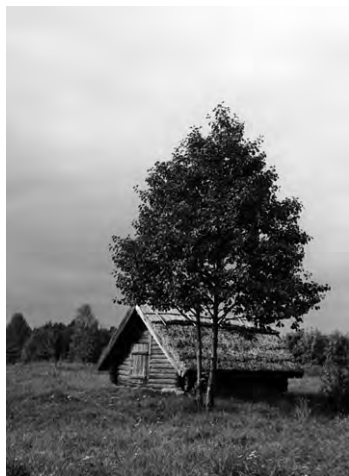
Амбар для хранения зерна из Западной Беларуси