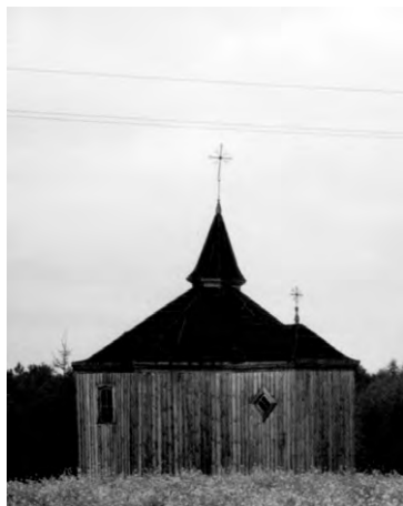
Часовни, как и костелы, сменили у белорусов древнейшие языческие капища