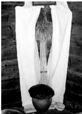
Сноп—«богач» в красном углу крестьянской хаты

Ветряная мельница (млын) из центральной Беларуси, сооружена в XVIII веке. Мельница у всех славян (и не только у них) была окружена множеством поверий и представлений, восходящих ко временам язычества. Некоторые наблюдения за устройством именно этой мельницы позволяют предположить, что она могла использоваться и как своего рода культовое сооружение (музей народной архитектуры и быта в Озерках)