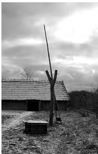
Колодца-журавель на заднім дварэ усадыбы (музей народнай архітэктуры і быта в Озерках)