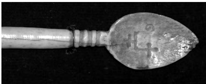
Костяная ложка XVI века с магическими знаками, использовавшаяся для лечебных целей (музей древнебелорусской культуры АН РБ)

Традиционный домовый оберег «паук», при- званный защи- щать жилище от нечисти и дурного гла- за. Такие обе- реги делали из соломы на определенный срок. Они могли иметь разный внешний вид, но всегда сход- ное назначение и собственно устройство