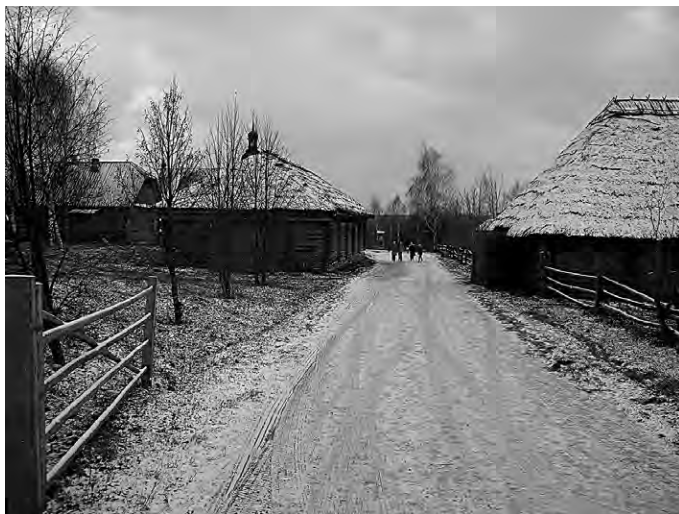
Вид традиционной белорусской деревни (музей народной архитектуры и быта в Озерках в окрестностях Минска)