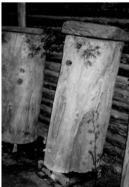
Борти, сохранившие весьма архаический вид. Сходно или даже также выглядели те древние борти, которыми пользовались славяне еще в IX–X веках. Мед и пчел окружало множество мифологических поверий и представлений. Точно также и бортник (позднее – пчеловод) мыслился человеком, связанным с иным миром, обладающим недоступными прочим людям способностями и знаниями (музей народной архитектуры и быта в Озерках)