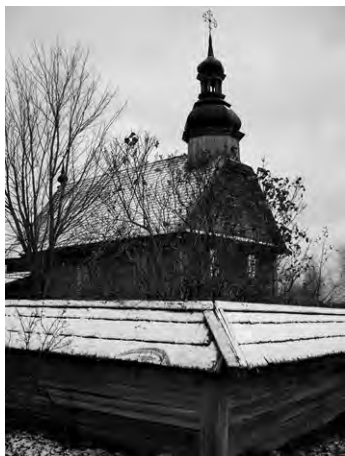
Униатский деревянный костел XVIIIвека (музей народной архитектуры и быта в Озерках)